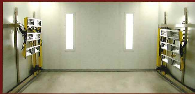
■標準レール長(総全長) 5460 (5580) mm